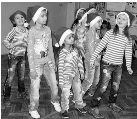
Вокальная группа «Колибри».